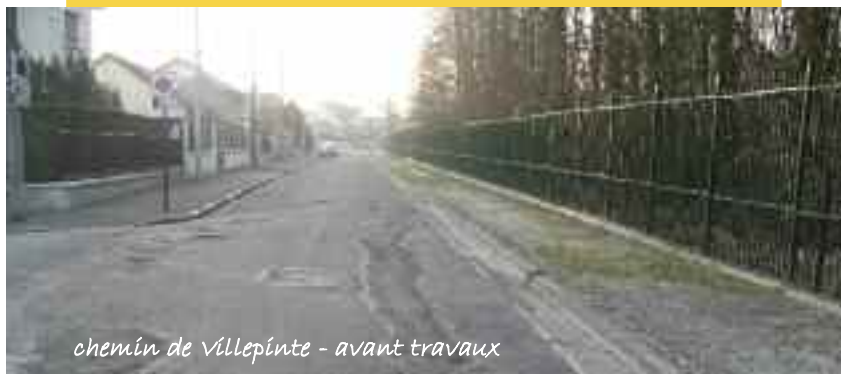
chemin de Villepinte - avant travaux