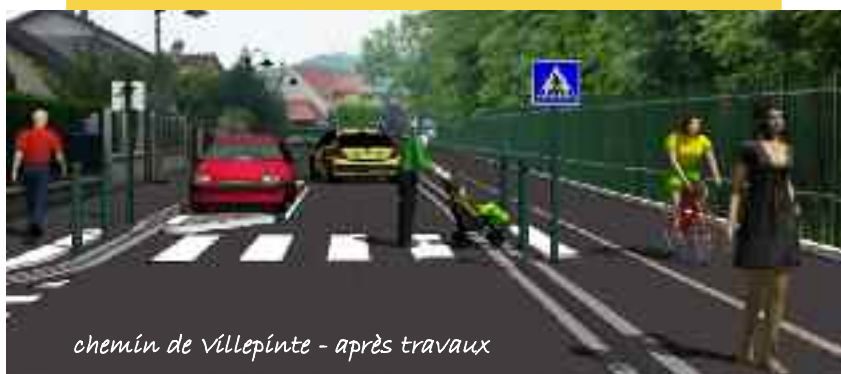
chemin de Villepinte - après travaux